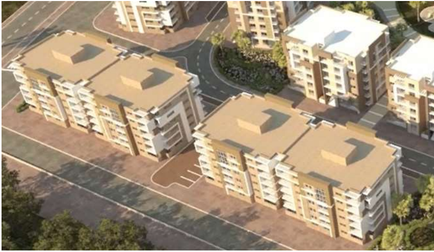
نموذج تخطيطي (عمارتين سكنيتين)